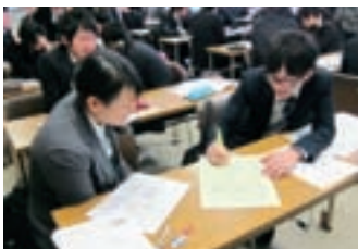
初任者研修の様子

A：子どもの実態に合わせて、課題設定や教材など、アレンジしていただいて結構です。