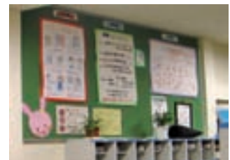
日常生活に生かした掲示物